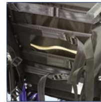
Dossier souple en canevas (std) Tension ajustable multidirectionnelle.