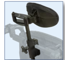
Appui-tête (en option) Ajustements multidirectionnels grâce à un support articulé.