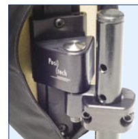
Support de butées (en option) Le mécanisme permet de les ajuster à la taille du patient.