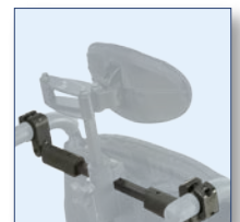
Barre de renforcement (en option) Permet de stabiliser le fauteuil, ainsi que maintenir les attaches du plastron et le mécanisme d'appui-tête.