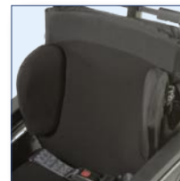
Butées thoraciques (en option) Quatre supports au choix, en version adulte et pédiatrique.