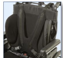
Plastron (en option) Possibilité d'installer un plastron avec l'ajout de la barre de renforcement au dossier.